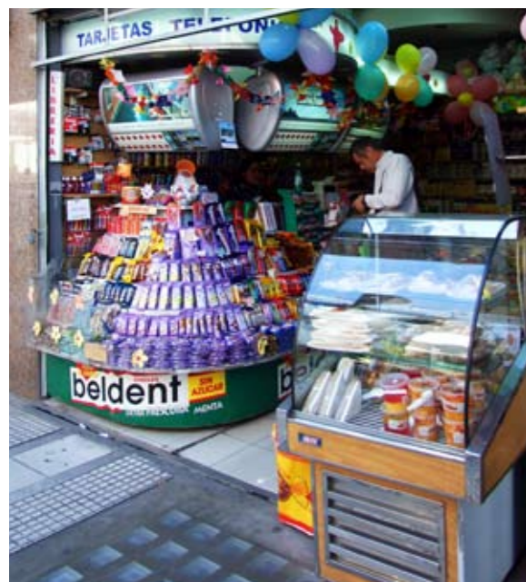
Van links naar rechts: IJsje eten op de stoep; het Sint Pieterplein met de basiliek; de koepel van de Sint Pieter; 'Romein' in het Forum Romanum.