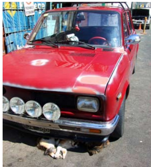
Van links naar rechts: Ijsje eten op de stoep; het Sint Pieterplein met de basiliek; de koepel van de Sint Pieter; 'Romein' in het Forum Romanum.