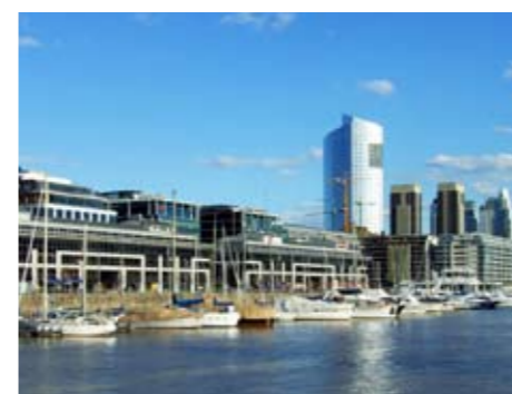
Het Colosseum; nonnen op de trappen van de Sint Pieter.

af een uur of acht, maar tegen de lekkere trek zitten er in deze straat genoeg combinaties van koffiebar en banketbakkerij waar je lekker kunt zitten. Deze typische confiterias serveren café doble (koffie) met het broodje waar Argentijnen verslaafd aan zijn: een medialuna , letterlijk een halve maan, ofwel croissant (8 peso's). Nu de gemene trek weg is en het buiten wat koeler is geworden, stromen de parken en winkelstraten van de stad vol.