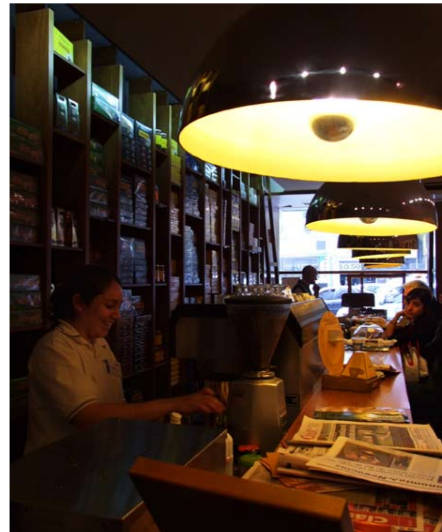
Van links naar rechts: Ijsje eten op de stoep; het Sint Pieterplein

Tussenstand: een kleine kater en nog 7 peso's over