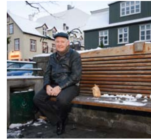
Uitrusten op een bankje - zonder handschoenen

Vlakbij dit natuurgeweld liggen de geisers waar IJsland beroemd om is geworden. Geysir is de grootste geiser die kokend heet water ineens tot zestig meter de lucht in blaast, maar de activiteit ervan wisselt per decennium. In het verleden probeerde men de geiser te activeren door hem uit te graven en door er zeep en stenen in te gooien. Sinds een aantal jaar spuit hij nog maar een paar keer per dag en daarom moet je vandaag de dag met een beetje pech de hele dag wachten om de enorme fontein te zien. Gelukkig is er Strokkur, een betrouwbare geiser die er pal naast ligt. Hoewel de fontein lang niet zo hoog en imposant is, spuit deze dag in dag uit om de zes minuten. Zo hoef je tenminste niet de hele dag te wachten en ben je op tijd weer terug in Reykjavik voor een plons in één van de thermale baden. ■