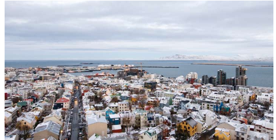
Uitzicht over de kleurrijke huizen van Reykjavik

mos begroeide lavawoestijn buiten de stad. Het melkachtige water barst van de mineralen en silicaten, dus geen wonder dat er een enorme spa naast het meer gebouwd is. Omdat het water tegen de veertig graden warm is, kun je er eindeloos in liggen met uitzicht op het zwarte lava en de bergen verderop, ook als het sneeuwt. Het zachte slib dat op de bodem ligt wordt gebruikt op de drijvende massagebedden waarop je half onder en half boven water ligt. Van het witte goedje worden allerlei heilzame huidverzorgingsproducten gemaakt - zo beweert men in de winkel bij de uitgang. Heilzaam of niet, rondzwemmen in het blauwige water temidden van een zwarte lavawoestijn is een bijzondere manier om te ontspannen tijdens een drukke vakantie.