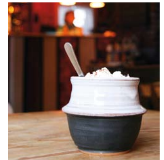
Boven: Opwarmen in een koffiebar Onder: Een warme kop chocolademelk om bij weg te smelten