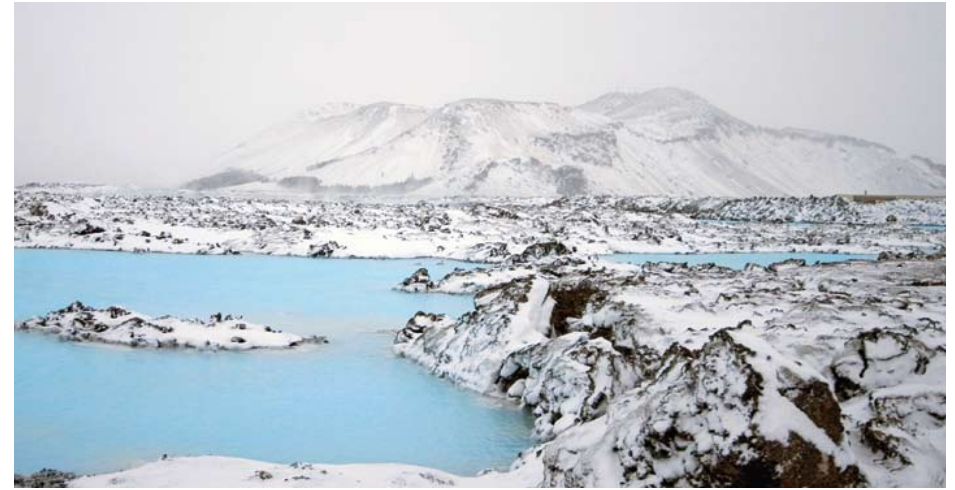
De Blue Lagoon: een helder opaalblauw meer in de besneeuwde lavawoestijn.

HIER KOMEN TWEA AARD- SCHOLLEN SAMEN, JE ZWEMT TUSSEN DE CONTINENTEN EUROPA EN AMERIKA