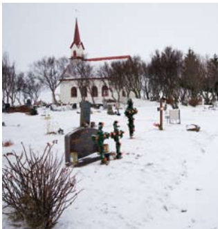
Boven: Het openluchtzwembad in Reykjavik is populier. Onder: Besneeuwd kerkhof net buiten de stad

lende decennia. Wat wél elke maand wisselt zijn de schilderijen aan de wand. Waar je na een slentertocht ook binnenstapt, opwarmen gaat altijd gepaard met stomende chocolademelk, grote mokken thee en verse koffie, waarmee je je lekker voor het raam kunt nestelen.