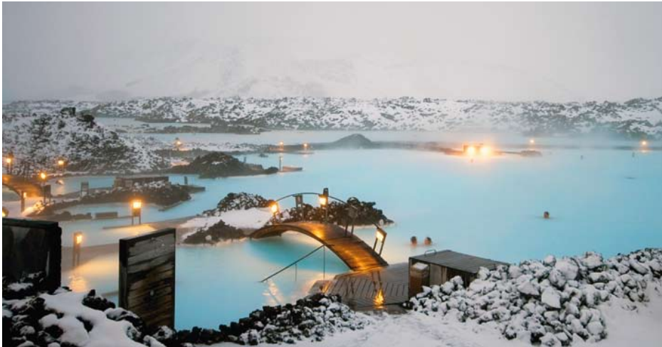
Tussen de sneeuw zwemmen in de Blue Lagoon